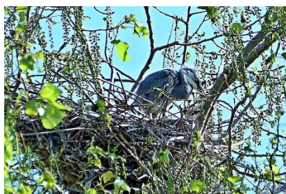
Junger Graureiher im Nest

Treffpunkt: wird bei Anmeldung (Name, Tel. Nr. / WhatsApp (WA), Anschrift, Mail-Adresse) per Mail/WA und danach auch auf der Homepage bekanntgegeben.